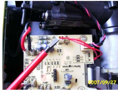
HD3620 (neue Version)