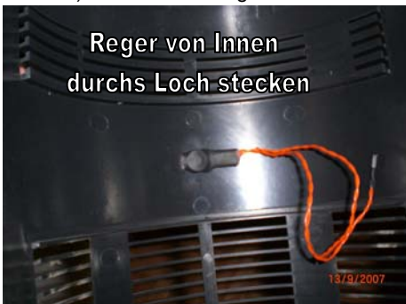
Regler von Innen durchs Loch stecken

c) Der Externe Regler wird durch ein Loch in der Rück- oder Seitenwand befestigt.