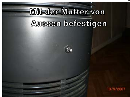
Mit der Mutter von Aussen befestigen