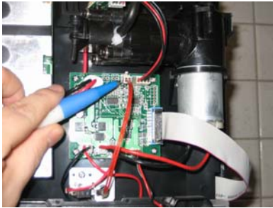
HD3620 (alte Version)