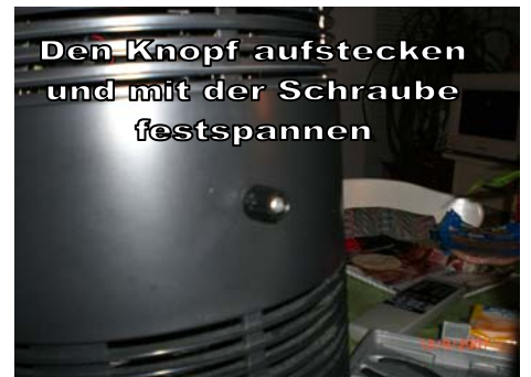
Den Knopf aufstecken und mit der Schraube festspannen